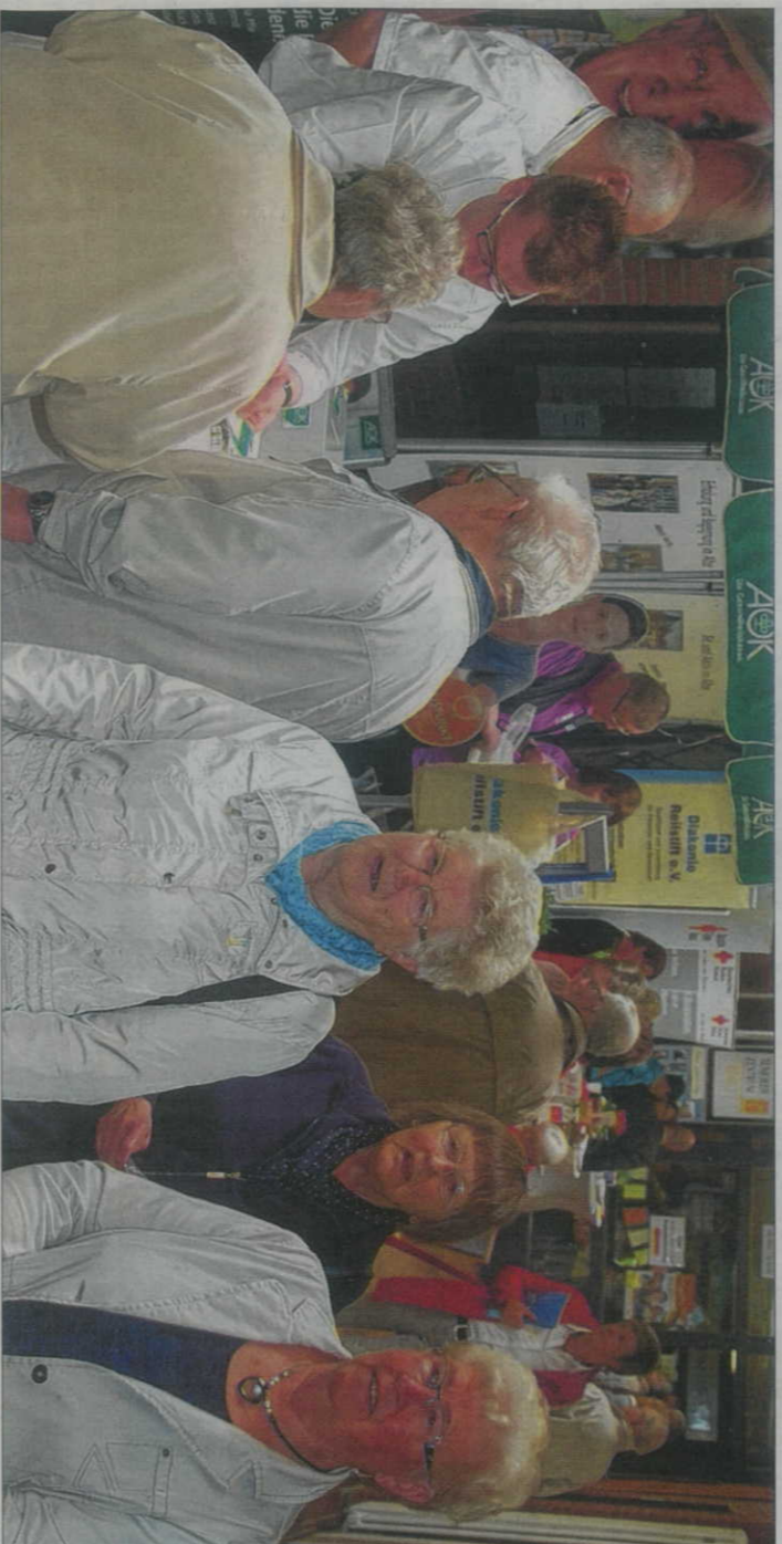
Den ganzen Tag über war die Messe gut besucht.

Gezeigt wurden gestern Produkte, die den Alltag der Senioren erleichtern können. Außerdem konnten die Besu-