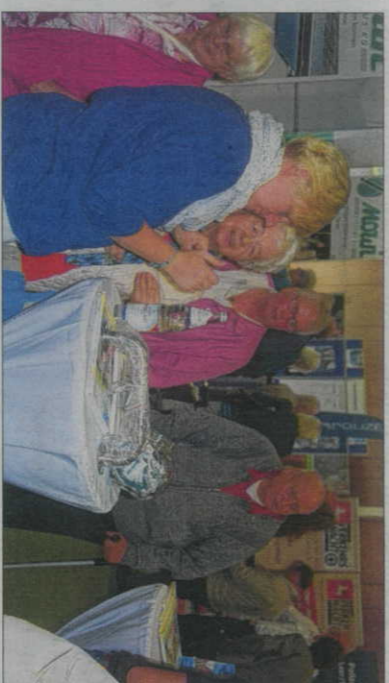
Ob Mobilität im Alter, Sicherheit oder seniorengerechtes Wohnen – an den Ständen gab es viele Informationen.

Landrat Bernhard Bramlage hatte den Seniorentag, der unter dem Motto „Leichtigkeit“ stand, am Vormittag eröffnet. Er wies darauf hin, dass die Lebenserwartung