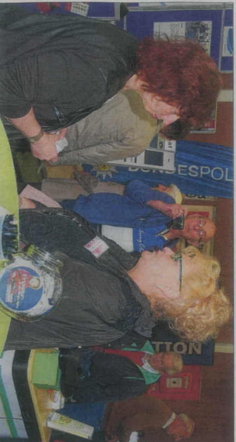
Die vielen Besucher des Seniorentages informierten sich an den Ständen der 60 Aussteller.